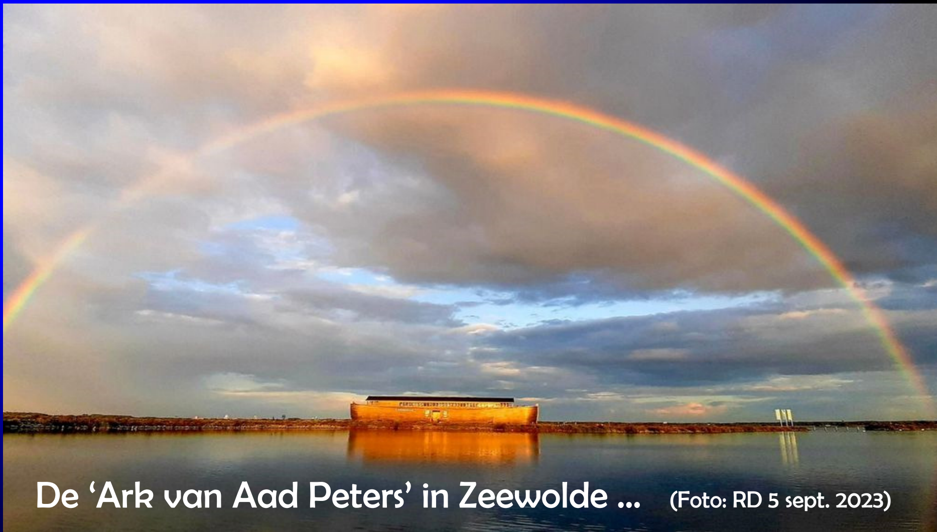
De 'Ark van Aad Peters' in Zeewolde ...